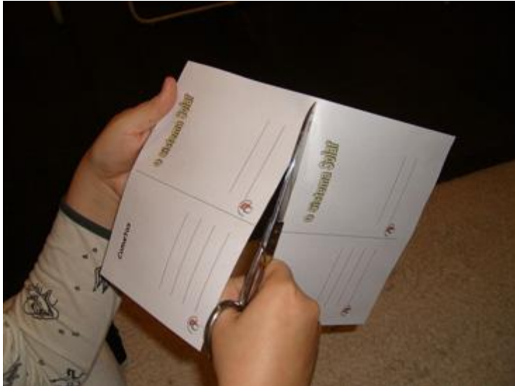
figura 2 - Folha sendo recortada

Após recortar as cinco folhas (figura 3) será possível construir dois passaportes.