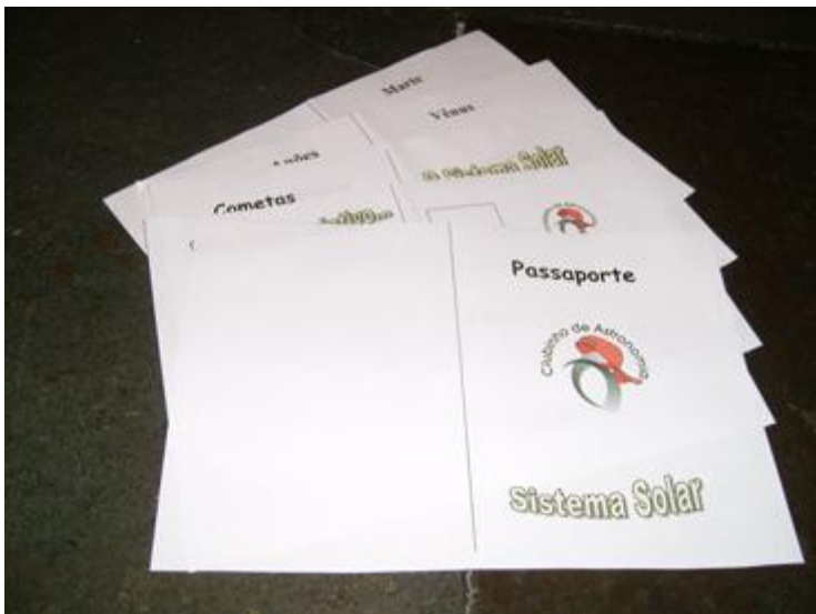
Figura 3 - As folhas recortadas

Após recortar as cinco folhas (figura 3) será possível construir dois passaportes.