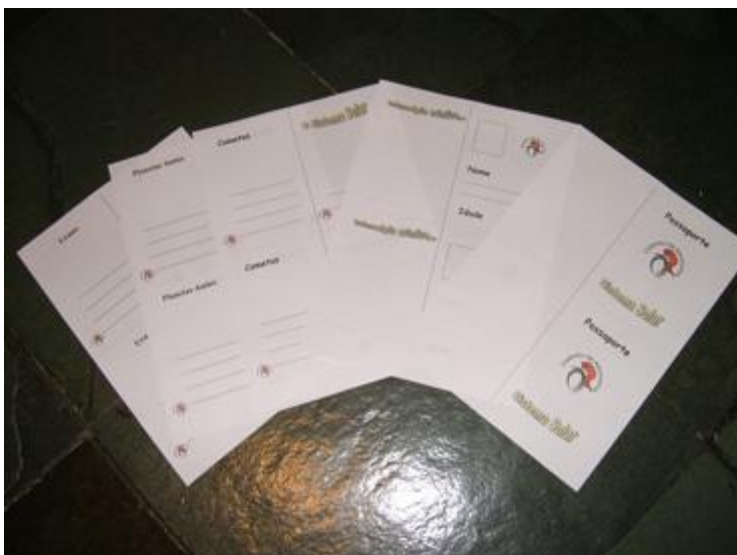
figura 1 - O passaporte impresso

O professor deve usar o papel no formato A4.